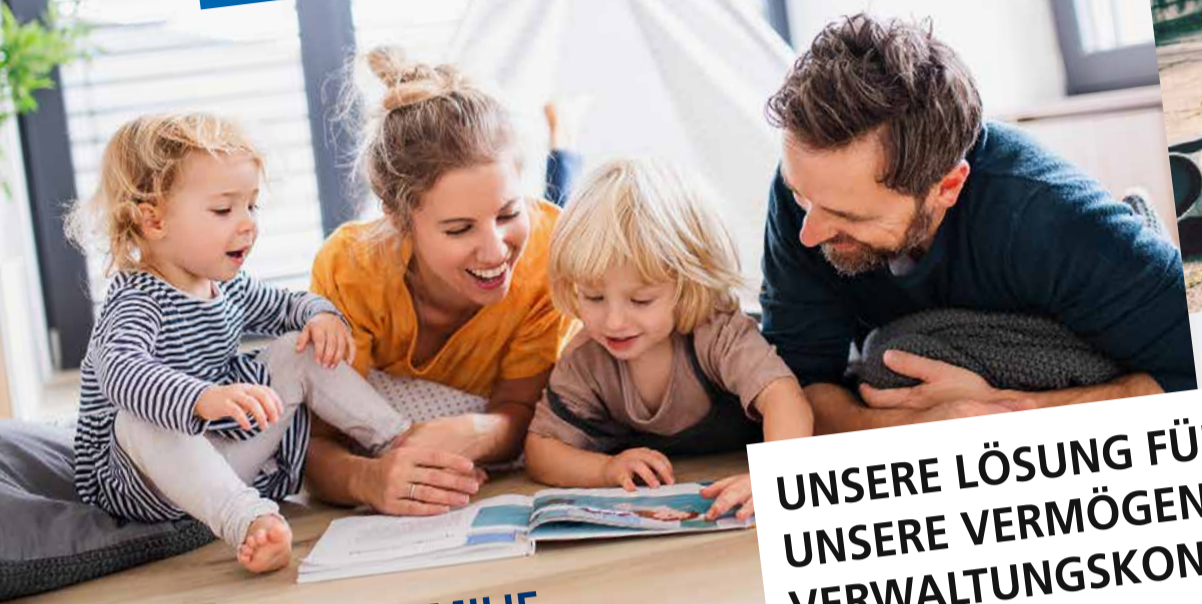
BOCK AUF FAMILIE

UNSERE LÖSUNG FÜR SIE: UNSERE VERMÖGENS- VERWALTUNGSKONZEPTE! SPRECHEN SIE MIT UNS. WIR BERATEN SIE GERNE.