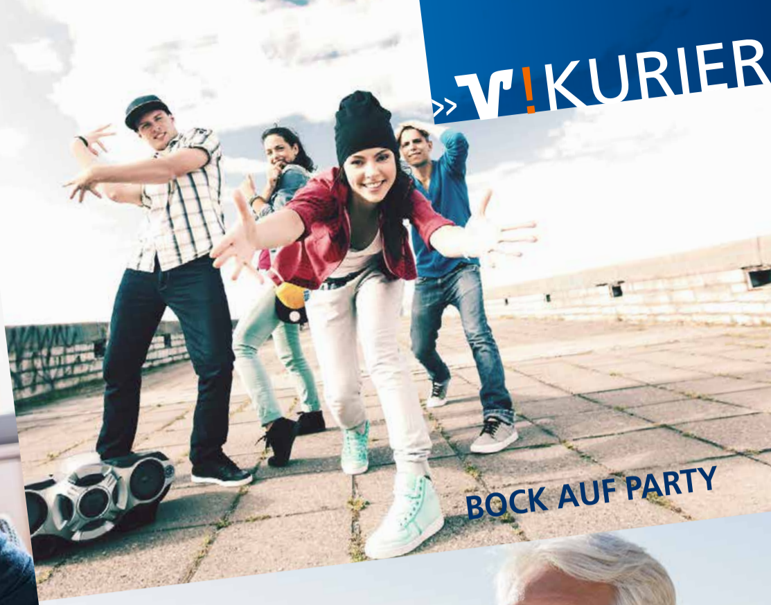
BOCK AUF PARTY

ALLES SUPER, ABER WER KÜMMERT SICH UM MEIN VERMÖGEN?