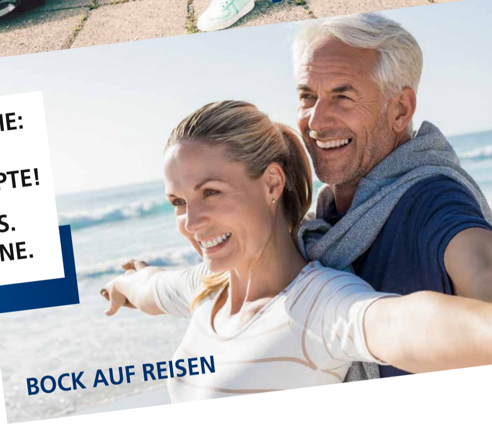
BOCK AUF REISEN

Sie leben Ihr Leben und wir sorgen dafür, dass Geld anlegen und sparen einfach bleibt. Unsere Vermögensverwaltungslösungen bieten Ihnen in jeder Lebensphase Sicherheit, Nachhaltigkeit, passende Konzepte und eine stabile Wertentwicklung!